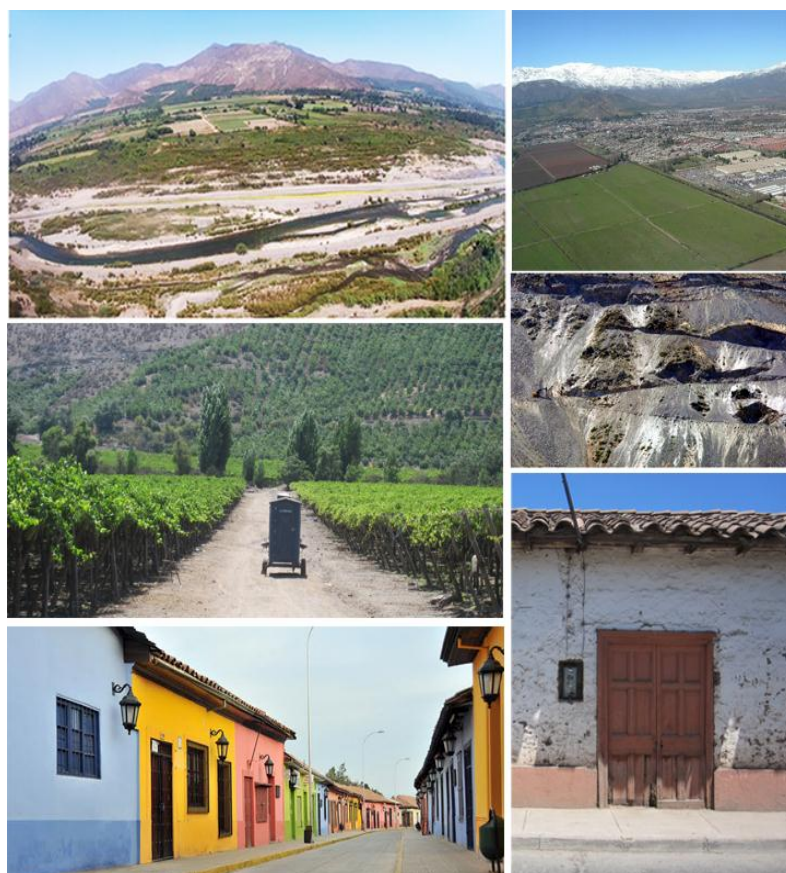
Imagen1: Diversidad de entidades territoriales rurales en el Valle del Aconcagua

En el contexto anterior, la Secretaría Regional Ministerial Región de Valparaíso llama a licitación los trabajos referidos a la consultoría: "MODIFICACIÓN AL PLAN REGULADOR METROPOLITANO DE VALPARAÍSO - SATÉLITE ALTO ACONCAGUA: PROVINCIAS DE SAN FELIPE Y LOS ANDES - AJUSTES DE COMPONENTES Y APOYO A LA APROBACIÓN", la que tiene por principales tareas: revisar críticamente, ajustar, mejorar, proponer modificaciones y complementar los componentes del plan entregados en 2015, apoyando técnicamente a la SEREMI en la materialización de las acciones necesarias para la aprobación del instrumento.